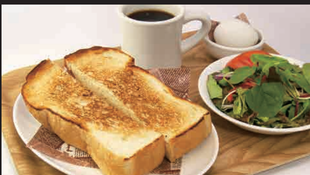
トースト・ゆで卵・サラダ・コーヒー(紅茶) ¥570