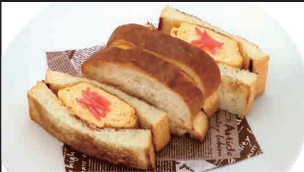
だし巻きたまごサンド セット ¥950 単品 ¥800

※セットのドリンクは、コーヒーまたは紅茶(ホット)です。80円追加でジュースに変更できます。 その他 350円以上のお飲み物への変更は差額料金の追加が必要です。 ※税込価格で表示しております。