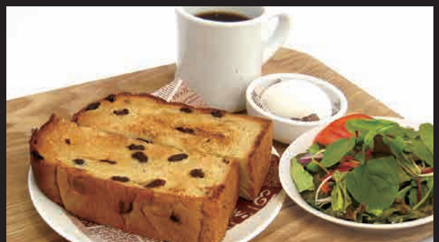
ぶどうパントースト・ゆで卵・サラダ・コーヒー(紅茶) ¥610