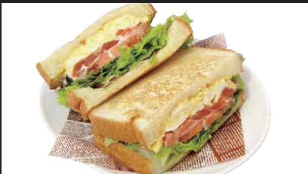
匠のサーモンサンド セット ¥950 単品 ¥800