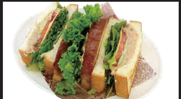
匠のツナミックスサンド セット ¥850 単品 ¥700