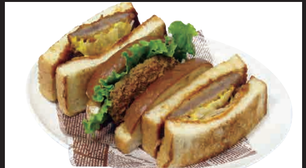
特製ビーフカツサンド (チーズ入り) セット ¥950 単品 ¥800