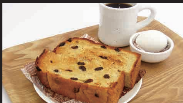
ぶどうパントースト・ゆで卵・コーヒー(紅茶) ¥520