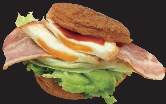
クロワッサンベーコンエッグサンド