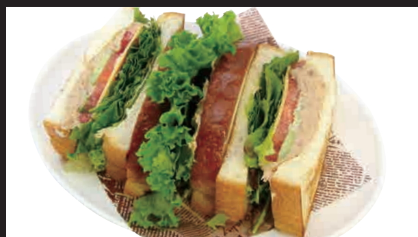
匠のツナミックスサンド セット ¥900 単品 ¥730