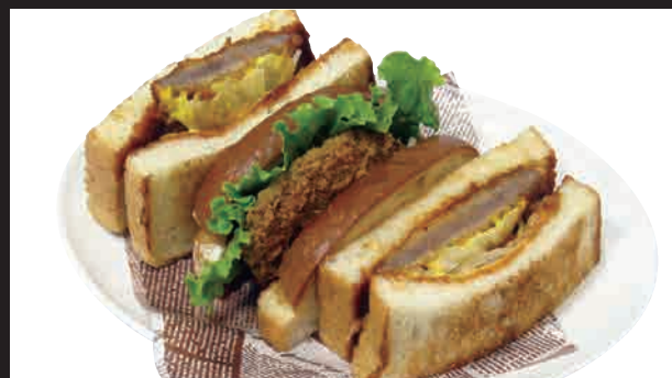
特製ビーフカツサンド (チーズ入り) セット ¥1,000 単品 ¥830