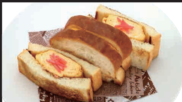
だし巻きたまごサンド セット ¥1,000 単品 ¥830

※セットのドリンクは、コーヒーまたは紅茶(ホット)です。 その他のお飲み物への変更は差額料金の追加が必要です。 ※税込価格で表示しております。