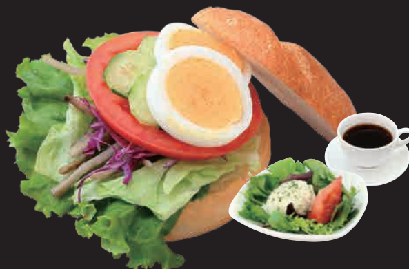
たっぷり野菜のカルネ