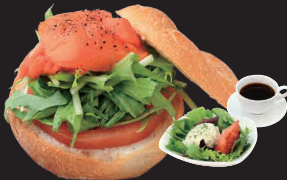
サーモンクリームチーズカルネ