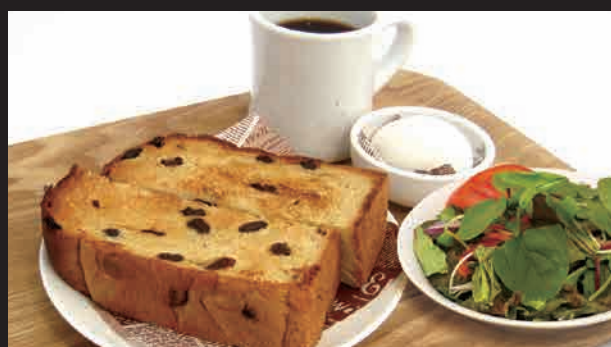
ぶどうパントースト・ゆで卵・サラダ・コーヒー(紅茶) ¥640