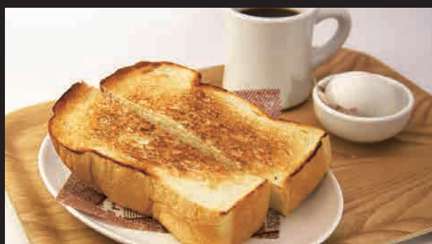
トースト・ゆで卵・コーヒー(紅茶) ¥480