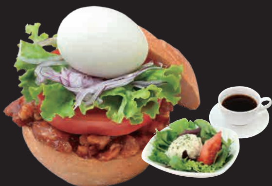
照焼チキンとまるごとたまごのカルネ